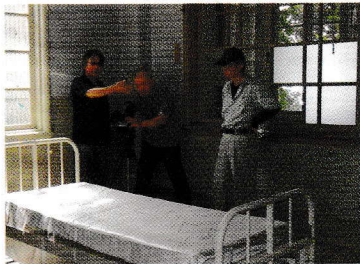
撮影中のスタッフたち